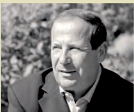
Le Maire de Fréjus Sénateur du Var

DEPUIS 2006, J'AI SOUHAITÉ QUE LA VILLE INNOVE EN PROPOSANT UN SERVICE MUNICIPAL EMPLOI ET LOGEMENT, SANS DOUTE UNIQUE DANS LA RÉGION, ET ACCESSIBLE À TOUS.