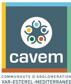
Schéma de Cohérence Territoriale de la CAVEM