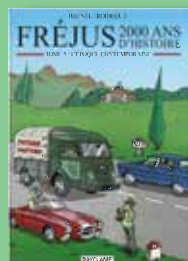
Tome 3 Période contemporaine 12 €