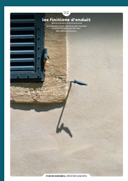
02 les finitions d'enduit