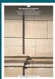
04 les décors en pierre de taille