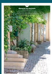
12 devant la maison

Qu'ils fassent ou non l'objet d'une protection, les centres anciens sont toujours des espaces de qualité. Chaque intervention sur les façades ou sur les toitures compte et participe à l'harmonie du paysage urbain. Au cœur de nos villes et villages, l'intérêt particulier et l'intérêt général doivent être conjugués pour créer le cadre de vie que nous y recherchons tous.