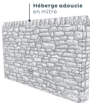
Héberge adouci en mitre

Muret ou mur, réalisé en maçonnerie de petits éléments avec finition enduit lisse sur les deux faces, en pierre sèche ou en pierre de taille.