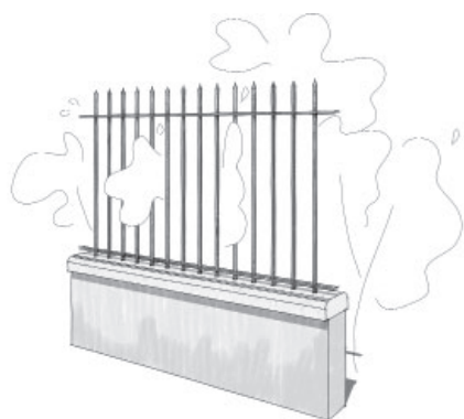
Muret bas surmonté d'une grille de formes simples, à barreaudage vertical.

Le matériau est souvent trouvé sur place, ses couleurs sont naturellement en harmonie avec le site. La pierre utilisée est recyclable de nombreuses fois. On le sait moins, mais l'humidité et l'ombre entre les pierres favorisent la présence de nombreuses espèces végétales et animales.