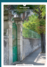
11 les clôtures

Qu'ils fassent ou non l'objet d'une protection, les centres anciens sont toujours des espaces de qualité. Chaque intervention sur les façades ou sur les toitures compte et participe à l'harmonie du paysage urbain. Au cœur de nos villes et villages, l'intérêt particulier et l'intérêt général doivent être conjugués pour créer le cadre de vie que nous y recherchons tous.