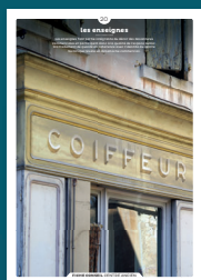
20 les enseignes

Qu'ils fassent ou non l'objet d'une protection, les centres anciens sont toujours des espaces de qualité. Chaque intervention sur les façades ou sur les toitures compte et participe à l'harmonie du paysage urbain. Au cœur de nos villes et villages, l'intérêt particulier et l'intérêt général doivent être conjugués pour créer le cadre de vie que nous y recherchons tous.