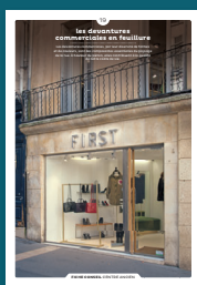
19 devantures commerciales en feuillure