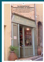
18 devantures commerciales en applique