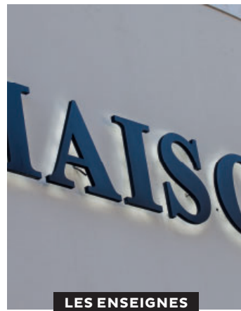
LES ENSEIGNES EN BANDEAU