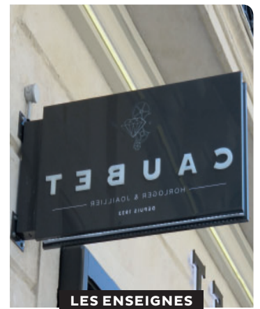
LES ENSEIGNES EN DRAPEAU