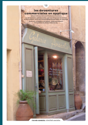
18 les devantures commerciales en applique