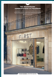
19 les devantures commerciales en feuillure

Qu'ils fassent ou non l'objet d'une protection, les centres anciens sont toujours des espaces de qualité. Chaque intervention sur les façades ou sur les toitures compte et participe à l'harmonie du paysage urbain. Au cœur de nos villes et villages, l'intérêt particulier et l'intérêt général doivent être conjugués pour créer le cadre de vie que nous y recherchons tous.