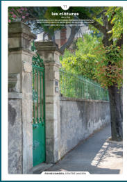
11 les clôtures

Qu'ils fassent ou non l'objet d'une protection, les centres anciens sont toujours des espaces de qualité. Chaque intervention sur les façades ou sur les toitures compte et participe à l'harmonie du paysage urbain. Au cœur de nos villes et villages, l'intérêt particulier et l'intérêt général doivent être conjugués pour créer le cadre de vie que nous y recherchons tous.