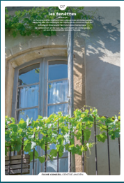
07 les fenêtres