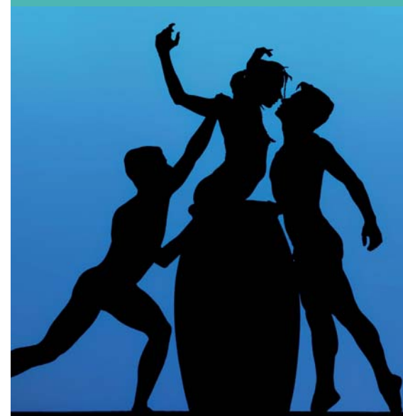
"Les Nuits" d'Angelin Preljocaj donneront le coup d'envoi la saison culturelle au Forum les 12 et 13 septembre prochains.

Théâtre Le Forum - 83, Bd de la Mer - Tél. 04 94 95 55 55