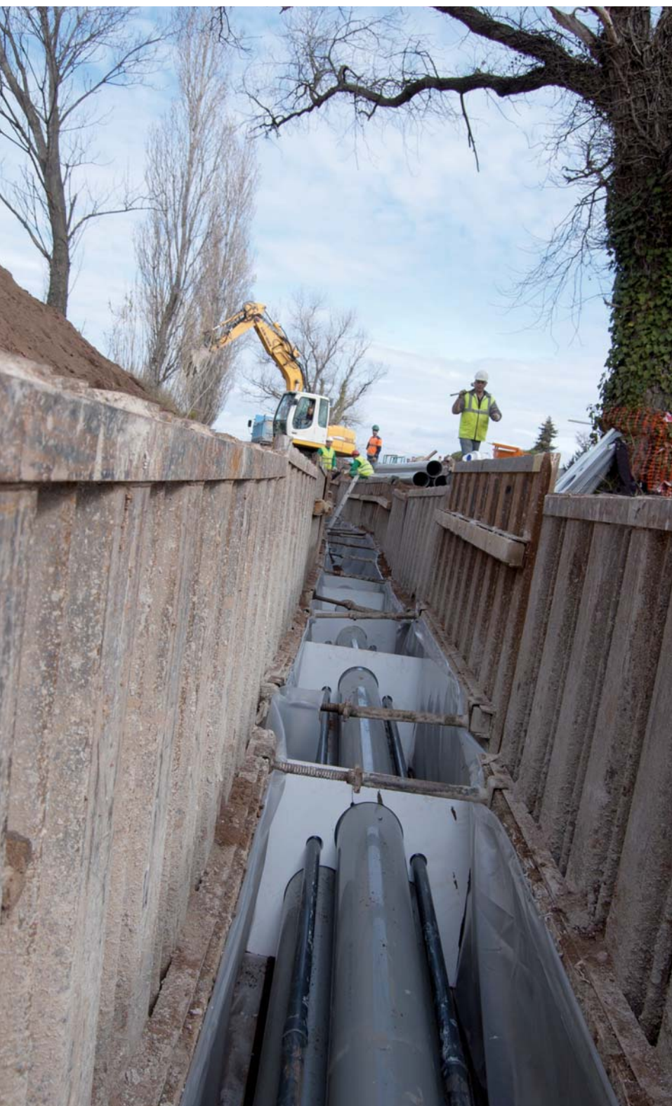
La ligne Fréjus-Biançon s'étire sur 25 km depuis le poste de l'Agachon jusqu'aux abords du lac de Saint-Cassien. Les câbles sont installés dans des fourreaux enterrés à 1,50 m de profondeur et recouverts de 70 cm de béton

Des travaux de génie civil viennent ainsi d'être réalisés entre l'Agachon et le chemin de la Vallée Rose le long du Reyran : il s'agit ici de réaliser le filet de sécurité PACA, chantier d'envergure qui consiste en la construction d'une ligne souterraine entre Fréjus et le lac de Saint-Cassien. Explications.