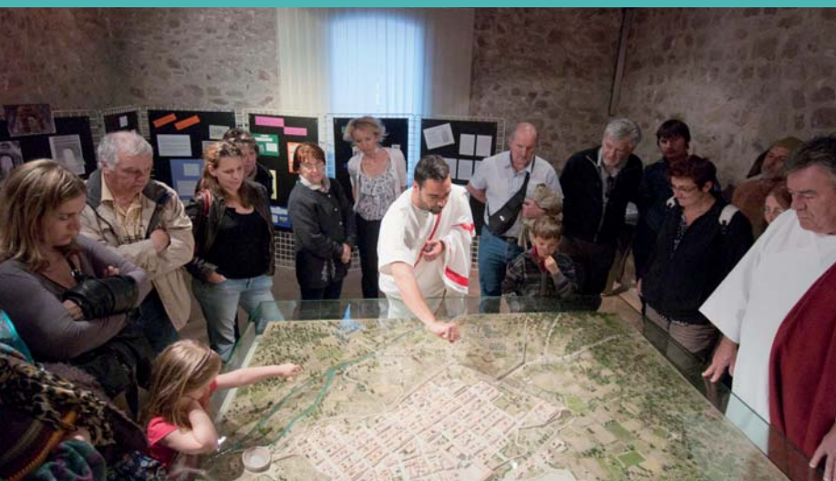
Au musée archéologique, les Fréjusiens pourront découvrir cette année encore Forum Iulii. Vu par les élèves du collège Villeneuve, et présenté par ceux du lycée Camus.

A.C.C. Malpasset - Tél. 04 94 53 62 34 Courriel : mercierjacques@sfr.fr