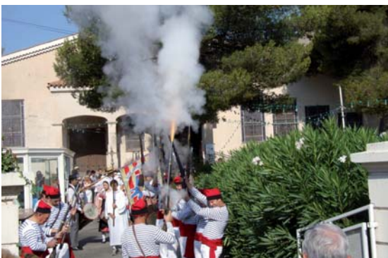
La fête votive est l'un des rendez-vous phares de la saison d'animations orchestrées par le syndicat d'initiative de Saint-Aygulf...

C'est déjà l'été ou presque du côté de Saint-Aygulf. Du moins un avant-goût de la saison estivale, dont la fête du quartier, le dimanche 2 juin prochain, marque en quelque sorte le début.