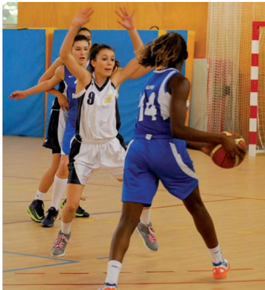
La sélection féminine Côte d'Azur, ici en blanc opposée à son homologue alpine lors des finales de zone le 30 mars dernier, n'est pas parvenue à se qualifier pour la grande finale nationale du week-end de l'Ascension. Mais les spectateurs auront tout loisir de découvrir les futures stars du basket hexagonal de demain...

La fine fleur du basket hexagonal, catégorie U15, sera réunie à Fréjus, du 8 au 12 mai prochain, pour la grande finale nationale du "T.I.L." (Tournoi Inter-ligues). Une compétition rassemblant donc les meilleures sélections interrégionales du pays, mais constituant surtout l'une des ultimes phases de détection pour postuler à une place en équipe de France de la catégorie ! C'est la deuxième fois, après la saison 2004-2005, que Fréjus accueille cette compétition. Trois raisons à cela. Des infrastructures qui s'y prêtent parfaitement, entre "salles de compétition - les Chênes et Sainte-Croix - et lieux d'hébergement - centre Azureva -", une situation géographique idéale - "au cœur de la Ligue organisatrice", en l'occurrence la Ligue Côte d'Azur, qui regroupe les départements des Alpes-Maritimes et du Var -