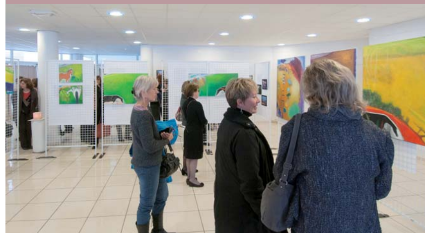
En marge des projections et débats, le public a apprécié l'exposition de peintures péruviennes des artistes de l'école des beaux-arts de Trujillo.