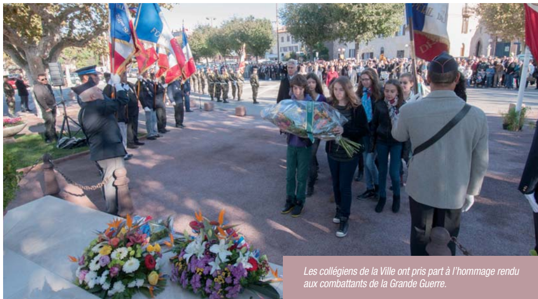
Les collégiens de la Ville ont pris part à l'hommage rendu aux combattants de la Grande Guerre.

Le 11 novembre dernier, hommage a été rendu aux soldats morts pour la France durant la Première Guerre Mondiale.