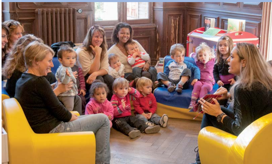
Rencontre autour du livre à la médiathèque pour les assistantes maternelles et les tout-petits dont elles ont la garde.

Toutes ces activités sont en outre ponctuées de sorties, à la Ferme des Esclamandes, à la petite ferme de Bagnols-en-Forêt, dans les parcs et jardins de la ville, etc. Les structures de la petite enfance ont aussi noué des partenariats avec certains équipements culturels de la Ville, à l'instar de la médiathèque Villa-Marie qui reçoit régulièrement les enfants des crèches et les assistantes maternelles, autour d'animations dédiées au livre et au conte.