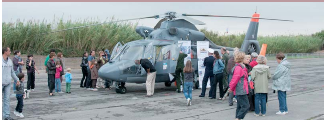
Souvenirs, souvenirs... autour de l'hélicoptère Dauphin lors de la manifestation en hommage à la base d'aéronautique navale.

Du 23 au 27 octobre, dans le prolongement de la commémoration du 100 e anniversaire de la traversée de la Méditerranée par Roland Garros, hommage a été rendu au site d'où il prit son envol. Tout particulièrement, le public a pu découvrir à l'espace Cacquot, historiquement le hangar des avions, une exposition rétrospective de l'histoire de la base d'aéronautique navale depuis sa création. Si les conditions climatiques n'ont pas permis en revanche à la démonstration aérienne programmée de se dérouler, le public n'en a pas moins profité de l'appareil au sol, un hélicoptère Dauphin de la Flotille 35F de la base aéronautique de Hyères.