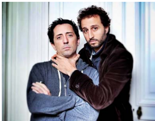
“Pourquoi pas” se faire remplacer par son frère pour l’inauguration d’un karaoké si la date choisie ne vous arrange pas ?... En tout cas, Gad Elmaleh, lui, opte pour cette solution dans “Welcome to China”.

Programme complet sur le www.frejus.fr (rubrique “grands événements”)