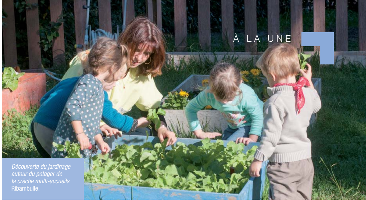
Découverte du jardinage autour du potager de la crèche multi-accueils Ribambulle.

Ils sont près de 600 petits Fréjusiens de 3 mois à 4 ans à être accueillis tout au long de l'année dans les structures municipales de la petite enfance, crèches et halte-garderies, ainsi qu'auprès des assistantes maternelles libérales soutenues par le Relais des Assistantes Maternelles (R.A.M.). Des chiffres auxquels il convient d'ajouter les 170 tout-petits en structures associatives. Un seul mot d'ordre, pas d'accueil sans éveil. Au programme des journées, des activités qui stimulent !