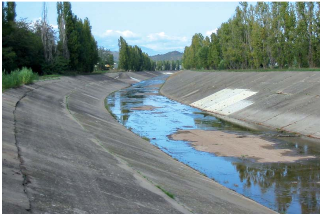
Un désherbage thermique du pied des digues du Reyran canalisé a été réalisé à l'automne dernier, en même temps qu'un nettoyage complet du radier. Ces opérations entrent dans le cadre des travaux de prévention et d'entretien des cours d'eau de la commune

De nouveaux chantiers d'entretien des rives du Reyran canalisé ont été menés ces dernières semaines et d'autres interviendront en ce mois de décembre. Ainsi, à l'automne 2012, la ville de Fréjus, par l'intermédiaire de son service de la Forêt, avait conduit une première phase de nettoyage, procédant notamment à l'abattage d'arbres ayant trouvé racine sur les bords du lit du cours d'eau (lire Fréjus Infos n°77 , février 2013).