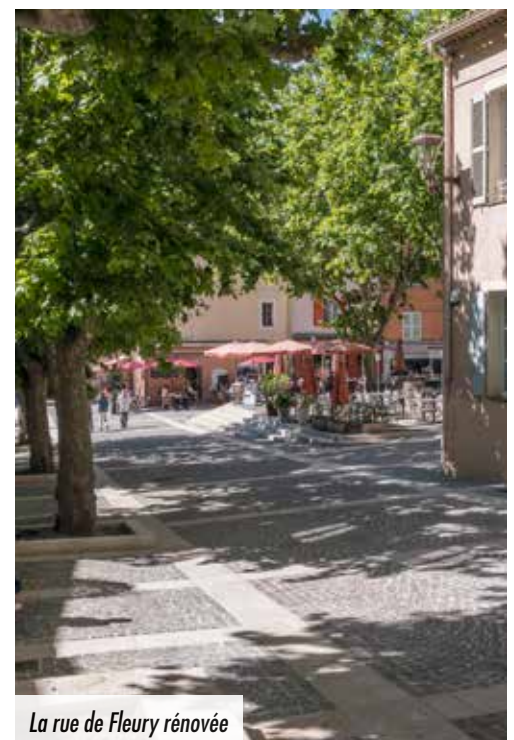
La rue de Fleury rénovée