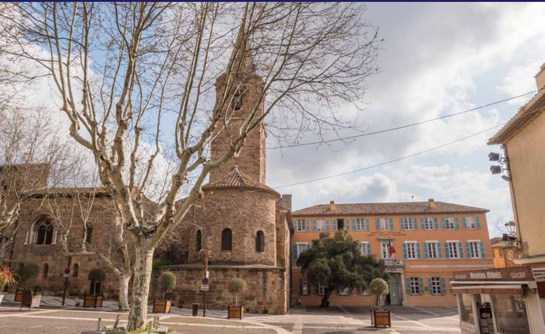
La place de la Mairie comme on ne l'a jamais vue, y compris en plein cœur de la saison hivernale : une des images fortes de ce printemps 2020, version confinement.