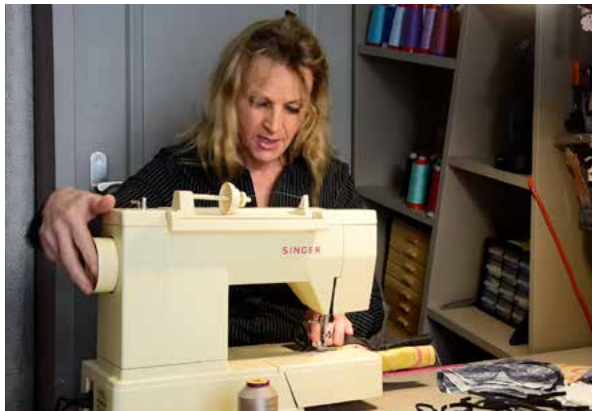
Accueil des enfants dits "prioritaires", ou encore confection de masques en tissu : il aura beaucoup fallu improviser durant ces 55 jours. Avant la libération fin mai et le retour à la plage.