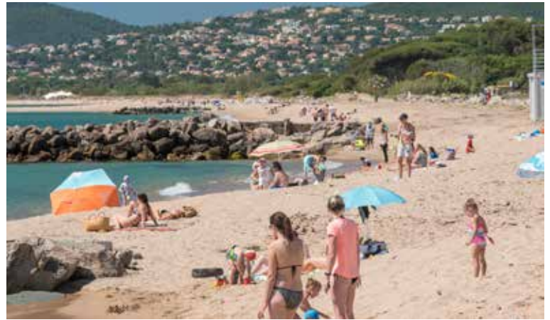
Illustration de quelques événements très attendus au sortir de la période de confinement: la réouverture des marchés ouverts, d'abord alimentaires avant d'accueillir les étals de produits manufacturés, la reprise des écoles, finalement actée les 4 et 8 juin puis enfin la liberté retrouvée d'aller lézarder sur nos plages préférées...