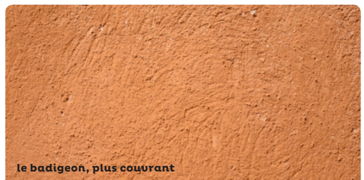
le badigeon, plus couvrant

Le fond de façade en enduit doit être vérifié par un examen attentif. Analysez les teintes de badigeons existantes avant restauration ou décroûtage. Consultez un professionnel (artisan-maçon ou architecte) pour le diagnostic, le suivi et la réalisation des travaux.