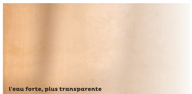
l'eau forte, plus transparente