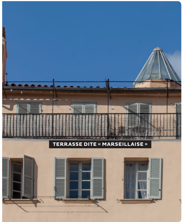
TERRASSE DITE « MARSEILLAISE »