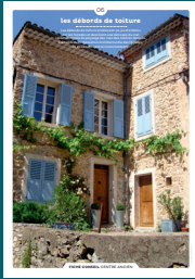
06 les débords de toiture