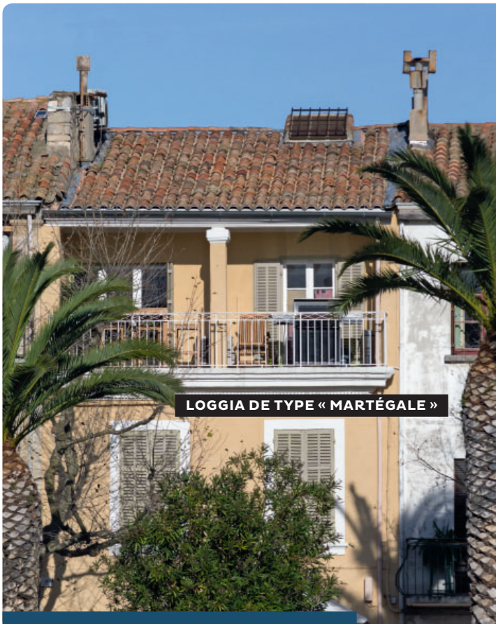
LOGGIA DE TYPE « MARTÉGALE »