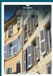
08 les volets