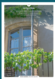
07 les fenêtres