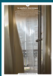
15 le confort thermique

Qu'ils fassent ou non l'objet d'une protection, les centres anciens sont toujours des espaces de qualité. Chaque intervention sur les façades ou sur les toitures compte et participe à l'harmonie du paysage urbain. Au cœur de nos villes et villages, l'intérêt particulier et l'intérêt général doivent être conjugués pour créer le cadre de vie que nous y recherchons tous.