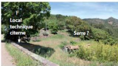
F Local technique citerne