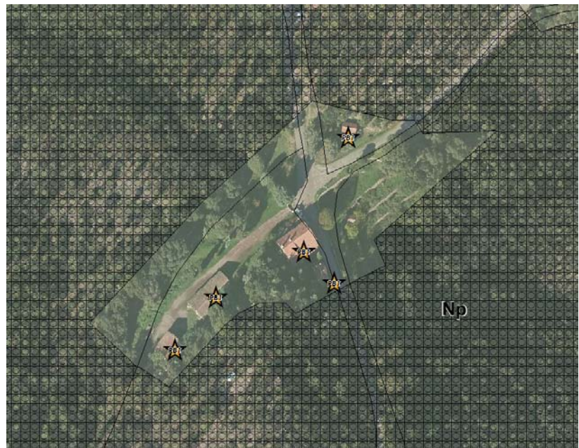
Extrait zonage PLU – Zone Np Malpey

Le Plan Local d'Urbanisme reconnaît la valeur patrimoniale de ces constructions, sans en autoriser le changement de destination.