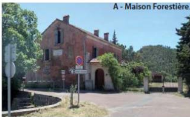
A - Maison Forestière.

PLU2 Plan Local d'Urbanisme DE LA VILLE DE FREJUS