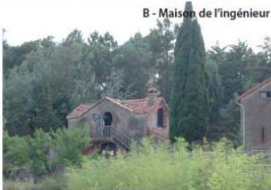
B - Maison de l'ingénieur