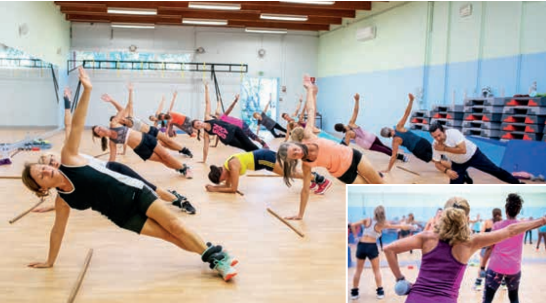
Les adeptes du fitness trouvent en cette nouvelle saison à l'AMSLF un lieu de pratique idéal et confortable

Chacun chez soi, et tout le monde est content !