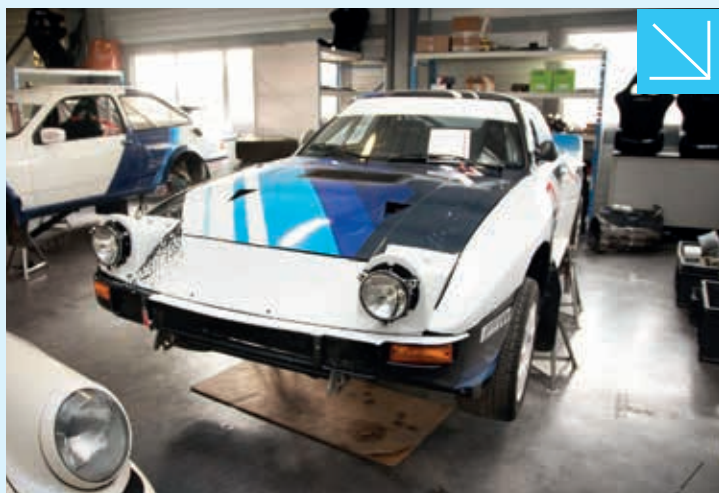
Les Mazda RX7 Groupe B courent de nombreux Rallyes.