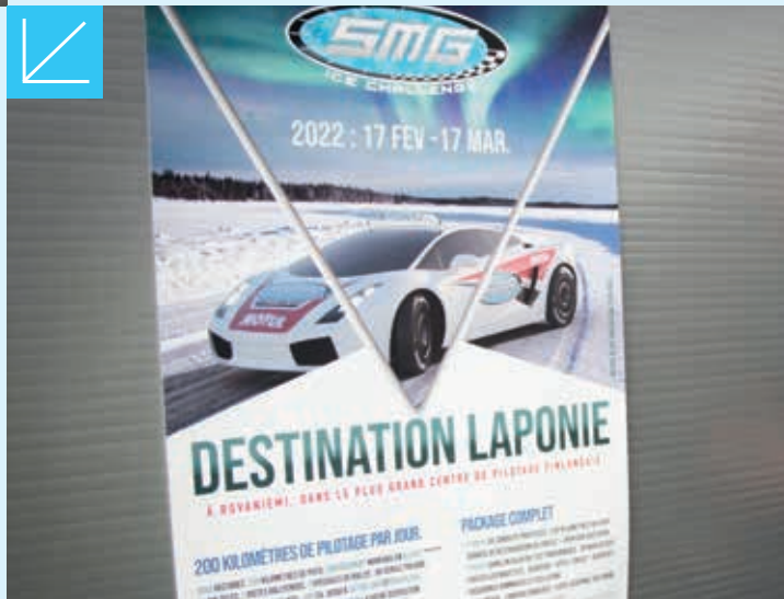
La 1 re session en février 2022 est complète.