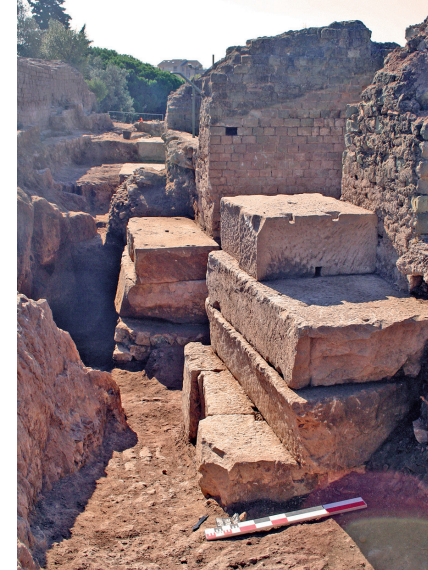
Fundamentblöcke einer Säule der Nordostfassade

wurden 1887 abgerissen, so dass die Gleichförmigkeit des antiken Baudenkmal wiedergegeben wurde. Es ist aber zwischen den Jahren 1960 und 1976, dass viel mehr Arbeiten geführt werden. Man darf nicht vergessen, dass bis zu diesem Zeitpunkt das Amphitheater ein gewaltiges Skelett darstellte: ein Teil des Gewölbes des Ambulakrums war eingestürzt; im südlichen Teil blieb nur noch das Mauerwerk, das als Sockel diente für die stufenförmigen Sitzreihen; im nördlichen Teil wurde das Gestein freigelegt so dass in der Mitte nur noch die Strukturen der Ehrentribüne sichtbar waren. Beträchtliche Arbeiten wurden während dieser Zeit durchgeführt: das Gewölbe des Ambulakrums wird wiederhergestellt und betoniert; die drei Bögen des kleinen Südeingangs werden neu gemacht, aber in zu hohen Verhältnissen; im Südteil werden zwei Sitzreihenebenen mit grünen Sandsteinen neu angelegt, aber ohne die Proportionen der antiken cavea zu respektieren; große Treppen erlauben wieder den Zugang zur zweiten Sitzreihenebene.