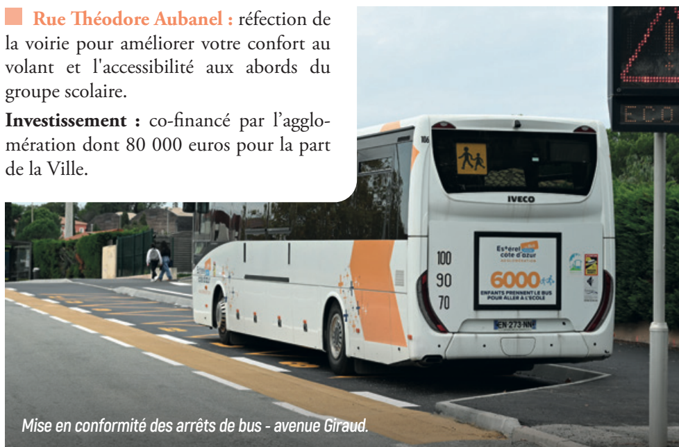
Mise en conformité des arrêts de bus - avenue Giraud.