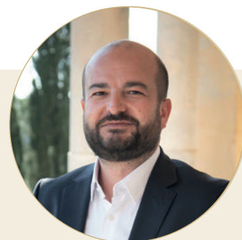
LE MOT DU MAIRE : DAVID RACHLINE

" Le Festival Sacrée Musique, c'est une véritable ode à la joie. Les concerts proposés sont une invitation à (re)découvrir différents styles musicaux: classique, jazz, gospel ou encore polyphonies corses dans les joyaux du patrimoine fréjusien que sont par exemple la Cathédrale Saint-Léonce ou la Villa Aurélienne. Quand l'histoire se mêle à l'art, cela permet de faire vivre au public une expérience musicale immersive grâce à la puissance du talent des artistes, conjuguée à une scénographie qui vous rapproche des réalités célestes. En tout état de cause, la Ville est fière de soutenir le Festival Sacrée Musique dont les concerts sont d'une beauté incomparable."