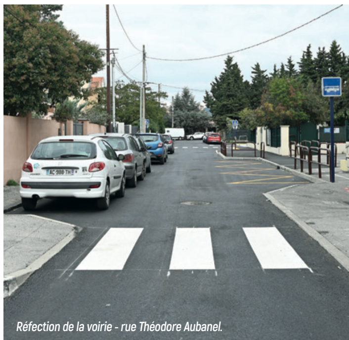
Réfection de la voirie - rue Théodore Aubanel.

La ville de Fréjus s'engage pleinement à améliorer votre cadre de vie grâce à des travaux de voirie et d'aménagement qui transformeront notre commune en un espace plus agréable et fonctionnel.