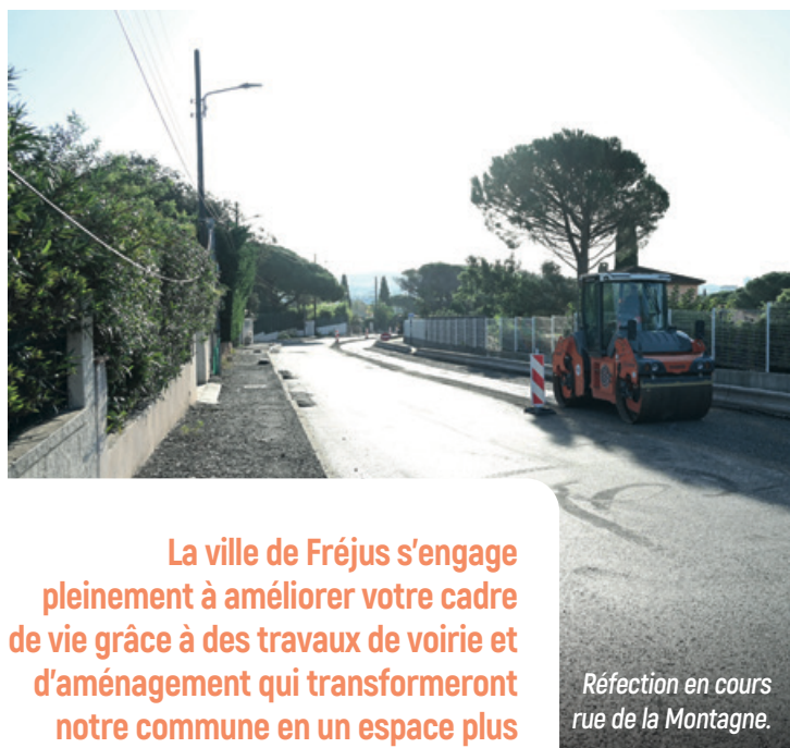
Réfection en cours rue de la Montagne.