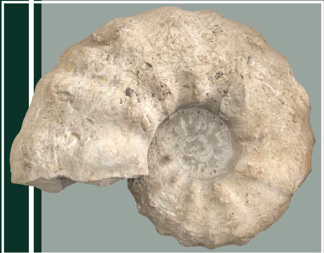
Nom : Acanthoceras Age : Crétacé supérieur (Cénomanien) Provenance : Alpes-de-Haute-Provence