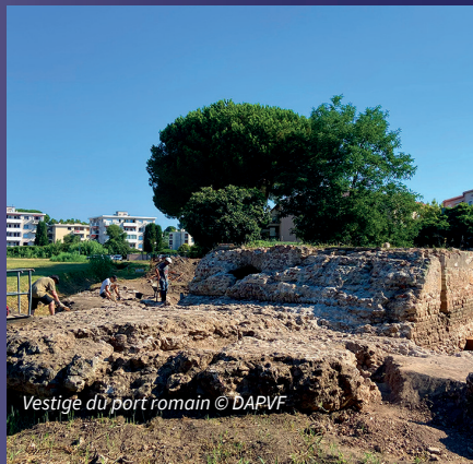
Vestige du port romain

Expositions et visites de fouilles ou de sites archéologiques emblématiques. Du 12 au 14 juin 2026