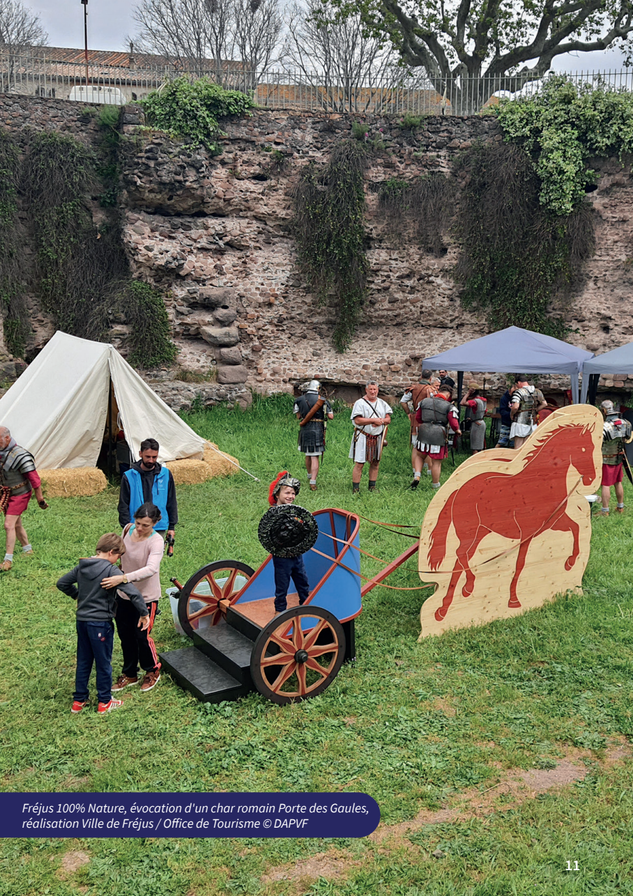
Fréjus 100% Nature, évocation d'un char romain Porte des Gaules, réalisation Ville de Fréjus / Office de Tourisme