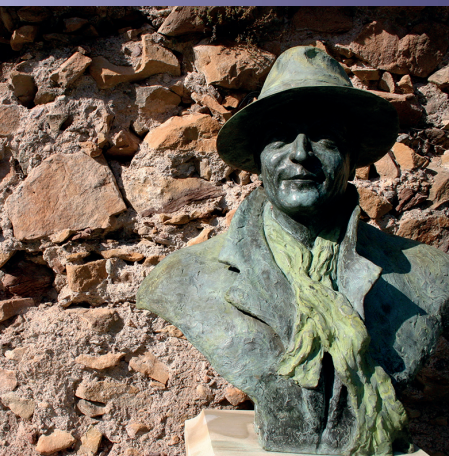
Buste de Philippe Léotard, Théâtre romain

Enfant de – 12 ans, personne handicapée (sur présentation d'un justificatif), guide conférencier agréé par le ministère de la Culture (sur présentation de la carte professionnelle), conservateur du Patrimoine territorial ou de l'État, journaliste (sur présentation de la carte professionnelle), membre de la Société d'Histoire de Fréjus et sa Région, classe dans le cadre de la convention Éducation Artistique et Culturelle et leurs accompagnateurs, et enseignant de Fréjus dans le cadre de la préparation de visites avec validation préalable.