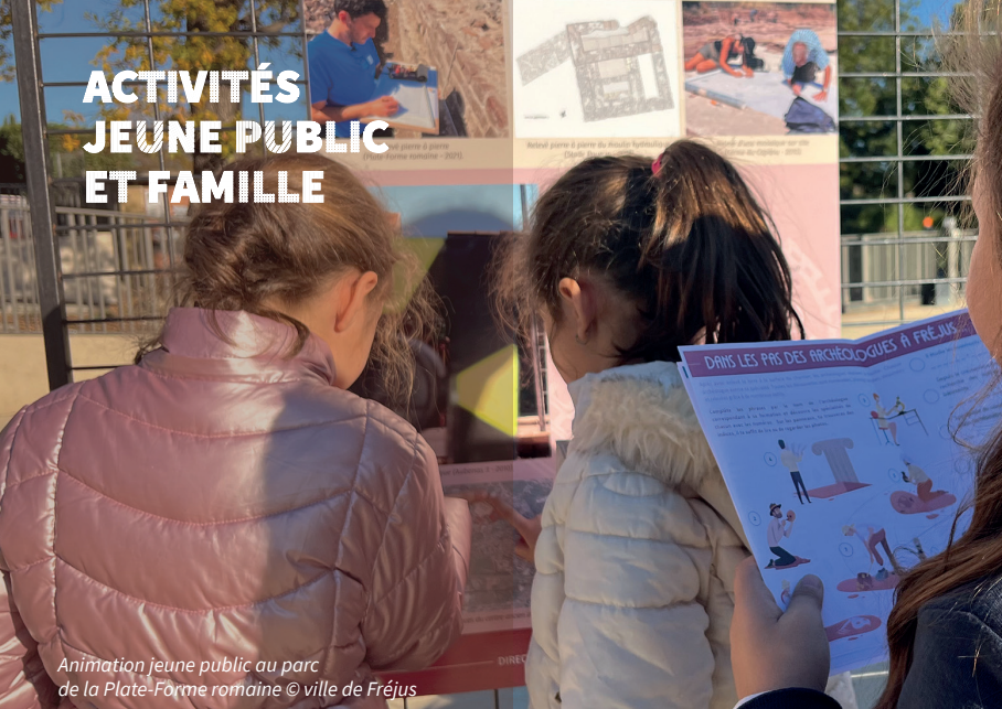
Animation jeune public au parc de la Plate-Forme romaine