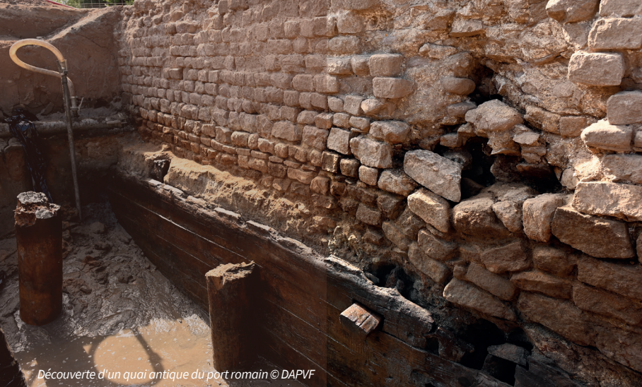
Découverte d'un quai antique du port romain