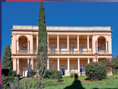
Villa aurélienne

D'avril à juin : le 1 er et 3 e mardi de chaque mois à 10h00