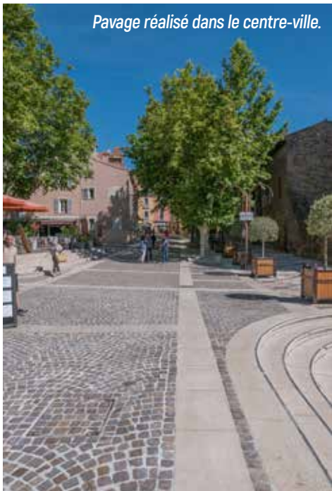
Pavage réalisé dans le centre-ville.