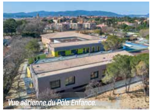
Vue aérienne du Pôle Enfance.