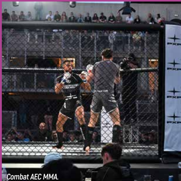
Combat AEC MMA.