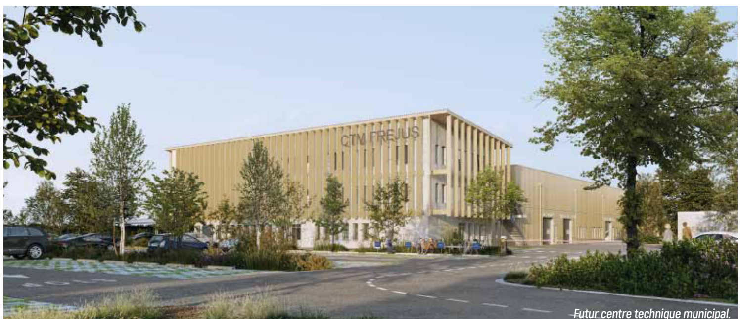
Futur centre technique municipal.

Station Balnéaire Station de Tourisme Commune Touristique