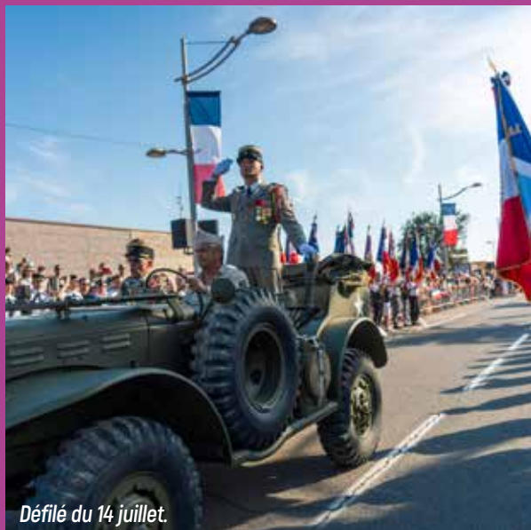
Défilé du 14 juillet.