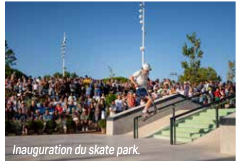
Inauguration du skate park.

Ce bilan témoigne d'une ligne constante depuis 2014 : investir utilement, entretenir durablement et construire une ville toujours plus agréable, plus moderne et plus attractive. C'est dans cette continuité que s'inscrit aujourd'hui la préparation du budget 2026.