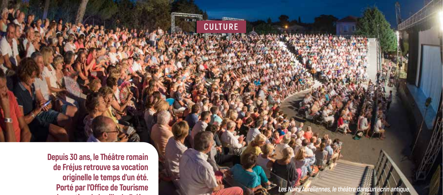
Les Nuits Auréliennes, le théâtre dans un écrin antique.