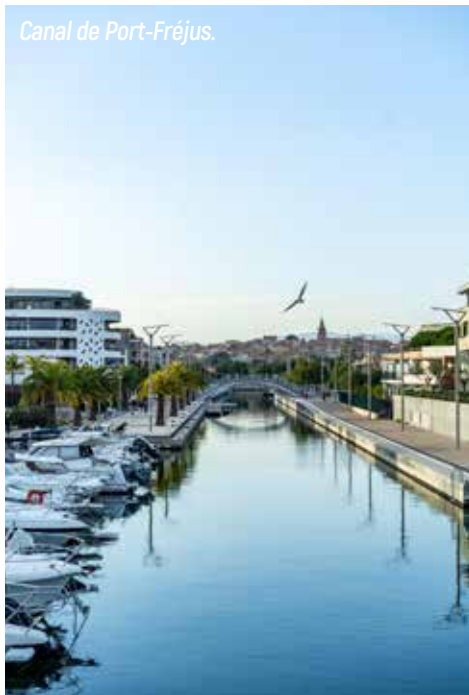
Canal de Port-Fréjus.