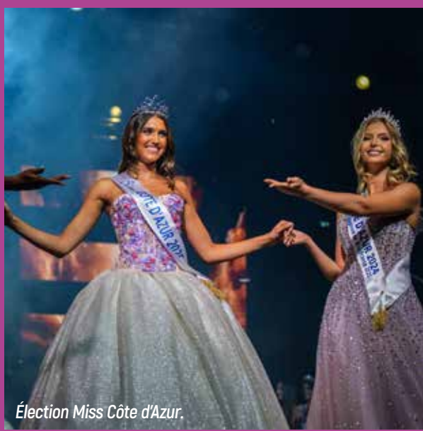
Élection Miss Côte d'Azur.