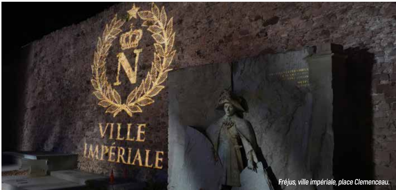
Fréjus, ville impériale, place Clemenceau.

À la tombée de la nuit, le cœur historique de Fréjus s'anime désormais d'une lueur nouvelle. Le parcours « la nuit révélée » invite les Fréjusiens et les visiteurs à une déambulation où l'histoire, l'art et la lumière s'entrelacent pour sublimer les rues de notre cité.