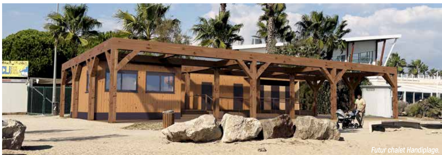
Futur chalet Handiplage.